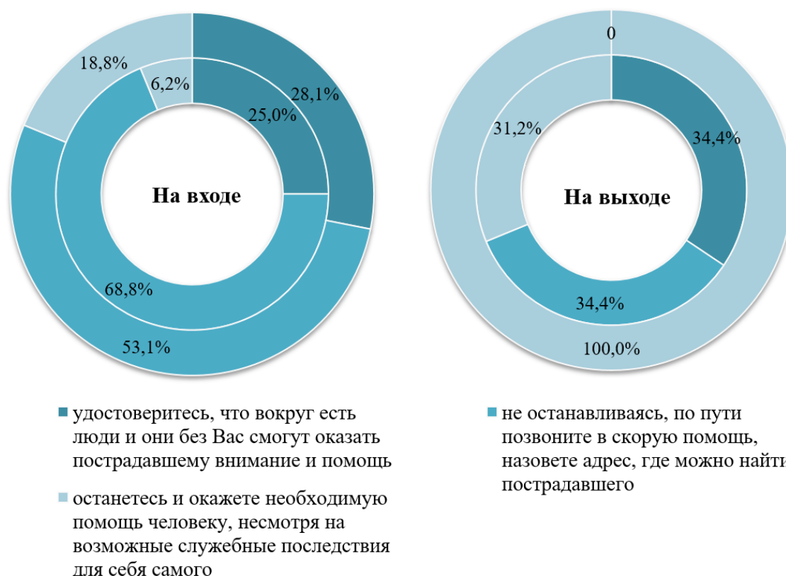
Рис. 3. Диагностика определения ценностных смыслов профессии «Полицейский» респондентами КГ и ЭГ «на входе» и «на выходе» в практической ситуации (внешний круг – ответы ЭГ, внутренний круг – ответы КГ)