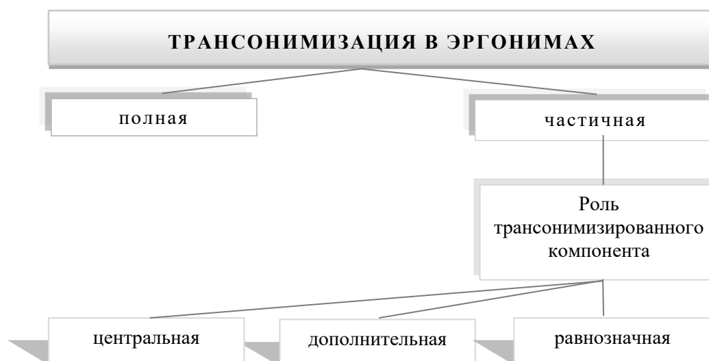
Рис. 1. Трансонимизация в эргонимах согласно степени трансонимизации и роли трансонимизированного элемента

компонентам эргонима. Степень трансонимизации в эргонимах с трансонимизационной компонентой и роль трансонимизированных элементов в составе эргонима могут быть представлены в схематической форме (рис. 1).